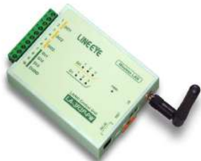
リレー接点出力: 3点、ドライ接点入力: 3点 LA-3R-3P-PW2 標準価格 ¥30,250(税込)

必ず該当型番の末尾に「-cbSET」を追加して ご注文下さい。(例: LA-3R3P-PW2-cbSET) 末尾「-cbSET」でないものには、延長同軸ケー ブルは付きませんので予めご了承下さい。